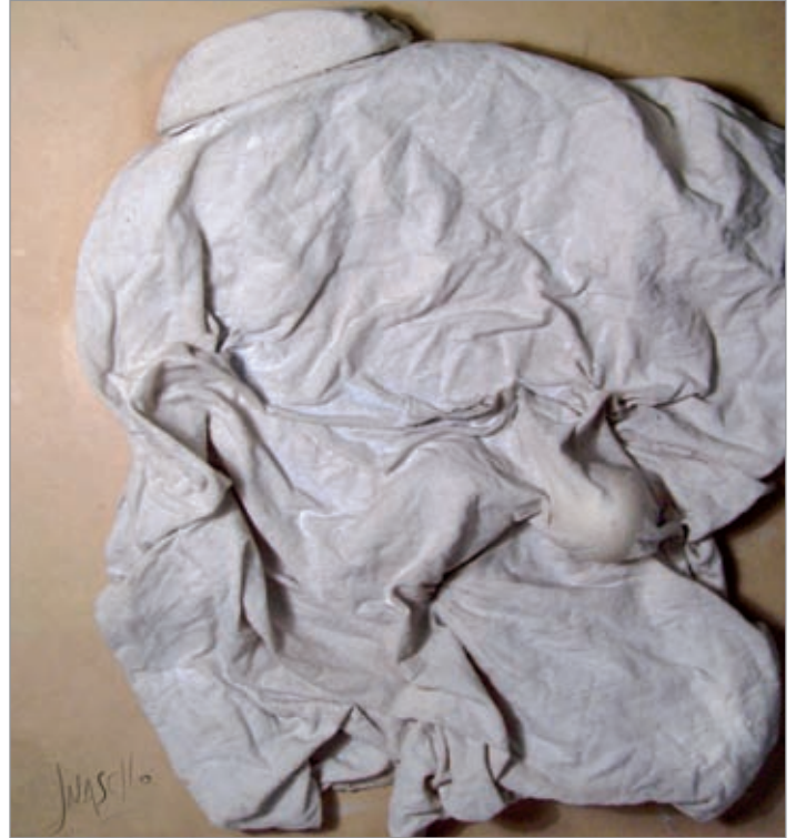
Juan Pablo II