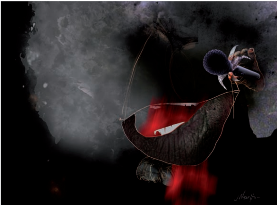
La Mona Jiménez