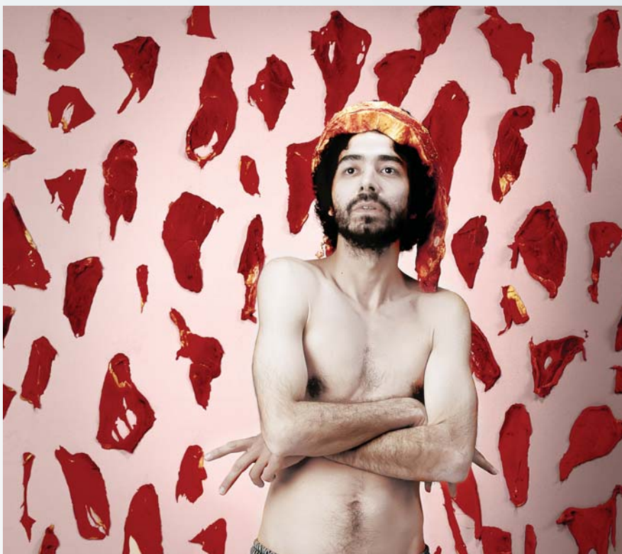
El Rey del Bife (100 x100, neg. color 6 x 6, impresión digital)

"Un corazón humano de treinta años. Referencia a tres décadas de democracia y al trabajo de recuperar los restos de los desaparecidos. En el cementerio San Vicente se identificaron 9 cuerpos y por eso el nombre. No es una imagen política o ideológica. Es una etapa vista desde otra generación y con elementos iconográficos de raigambre popular".