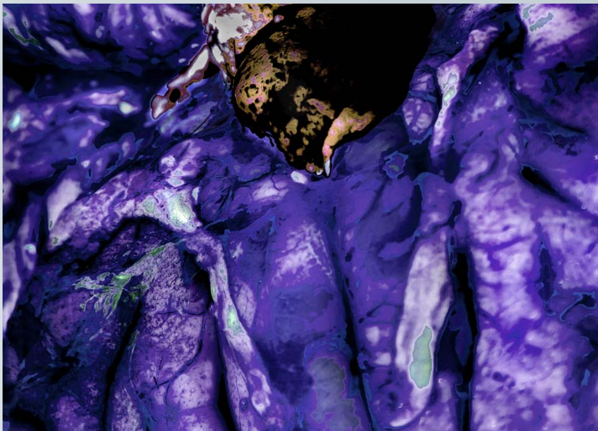
Aguafuerte Nº 9 - De la serie "Aguafuertes cordobesas" (Fotografía digital, plano detalle c/tratamiento color)

"Le saco un plano detalle a diferentes vísceras humanas. Hay una foto de la tabla interna del cráneo, un corazón, un tramo de intestino grueso... Luego comienzo a colorearlas digitalmente hasta que se van convirtiendo en una imagen que me sugiere el arte abstracto o hasta que me genera alguna clase de emoción visual".