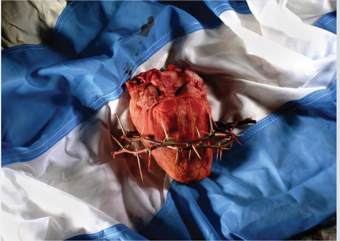
9 regresaron San Vicente (110 x130, neg. 6 x 7, impresión digital)

Esta es una selección personal y arbitraria de sus últimos trabajos. Tan personal y tan arbitraria como él mismo, por lo que esta galería es una especie de visita guiada donde las anécdotas del autor nos acercan íntimamente a la obra.