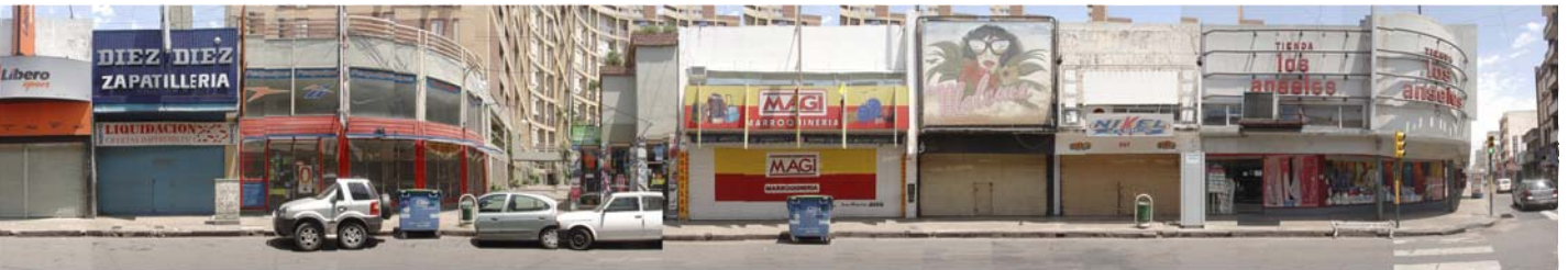
Peatonal San Martín al 200, 45 x 255 cm., impresión lambda, 2007.