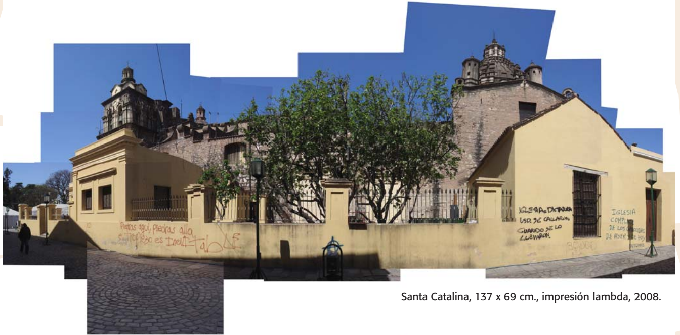
Santa Catalina, 137 x 69 cm., impresión lambda, 2008.