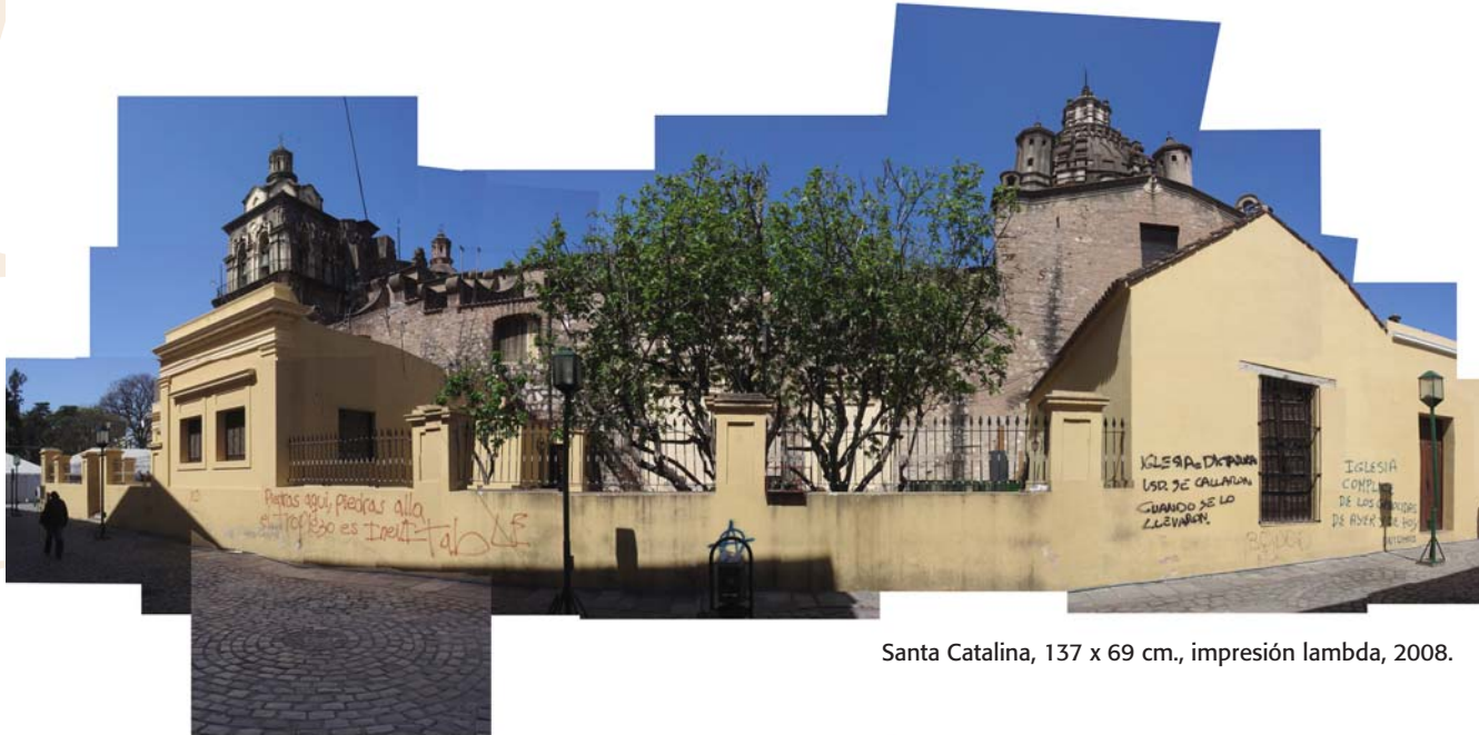
Santa Catalina, 137 x 69 cm., impresión lambda, 2008.