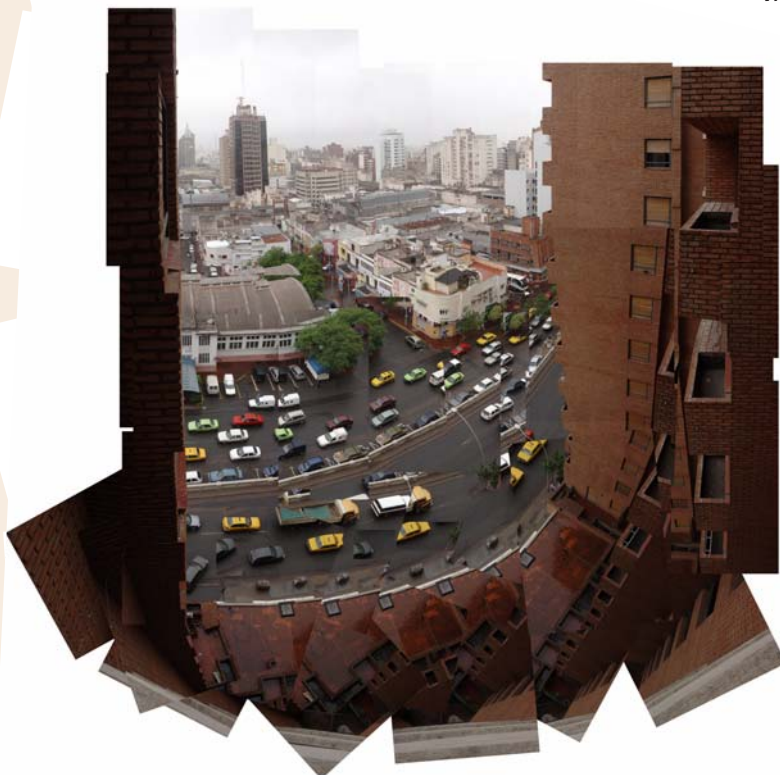
Balcón Illia nublado, 15 x 80cm., impresión lambda, 2005.