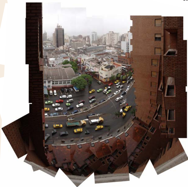
Balcón Illia nublado, 15 x 80cm., impresión lambda, 2005.