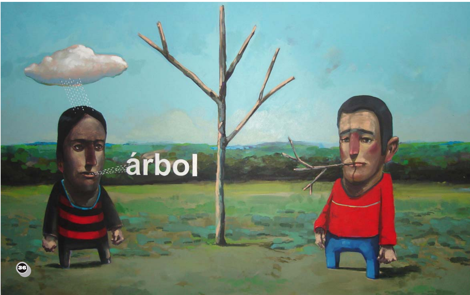
Árbol - Acrílico sobre tela - 1,40 x 0,90 m