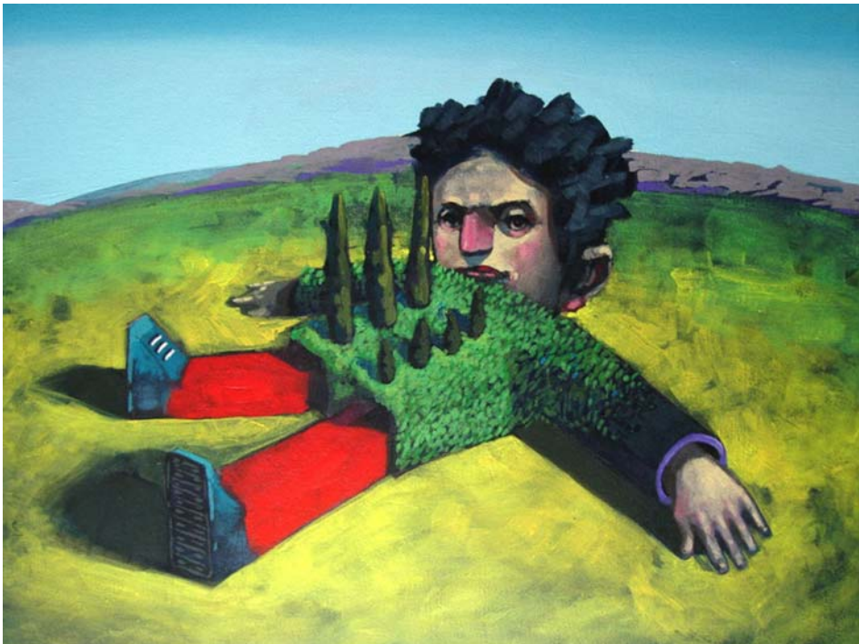
Tirado - Acrílico sobre tela - 40 x 50 cm