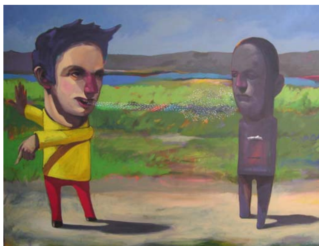
El iluminado - Acrílico sobre tela - 1,50 x 1,20 m