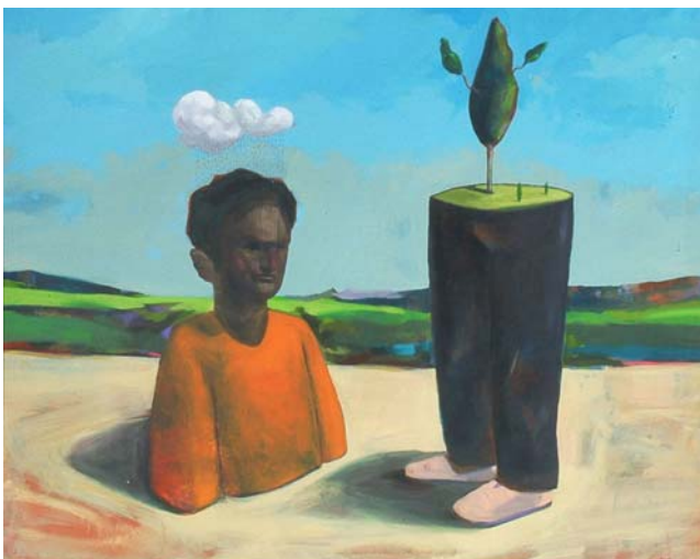
Ponerse en el lugar del otro - Acrílico sobre tela - 0,90 x 1,20 m

Este joven artista cordobés, de amplia formación en plástica, arte digital y diseño gráfico, participó de diversas muestras locales y nacionales entre las que destacan Arte BA, Corazón Cordobés, Adquisiciones 2, y los ciclos de Osde en el Museo Caraffa. En 2004 fue premiado con una mención durante la Muestra Colectiva del Salón Nacional del Palais de Glace (Buenos Aires).