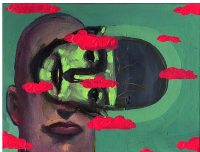
Sin título - Acrílico sobre tela - 24 x 18 cm