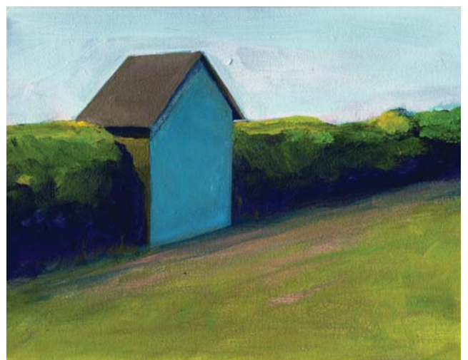
Sin título - Acrílico sobre tela - 24 x 18 cm