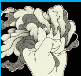
Los orfebres, 2007

gélidos, por un rato entre la bossanova y el tango, y de nuevo hacia el rock progresivo, en clave de psicodelia.