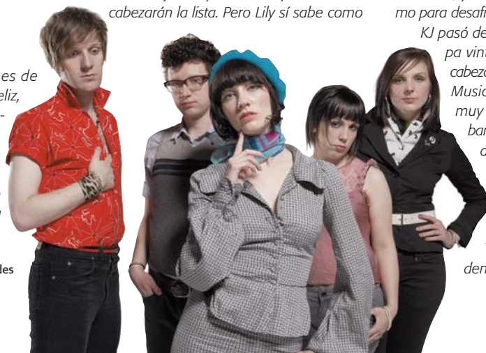
The Long Blondes