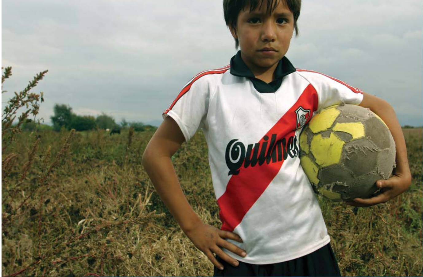
"Gol! Fútbol en la mira" / Instituto Goethe