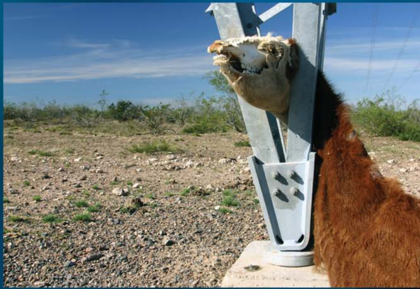
De la serie "Sur"

ÁLVARO CORRAL cursó la carrera de Fotografía y Diseño Gráfico en la Escuela de Artes Aplicadas "Lino Enea Spilimbergo". En el 2006 recibió el Primer Premio de Fotoperiodismo en el Concurso "Rodolfo Walsh", el más importante del interior del país, con la obra "Ya pasó", tomada durante el incendio del Concejo Deliberante de nuestra ciudad. Este fotógrafo cordobés participó de talleres nacionales e