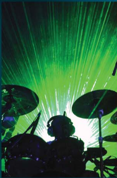
De la serie "RnR vivo"