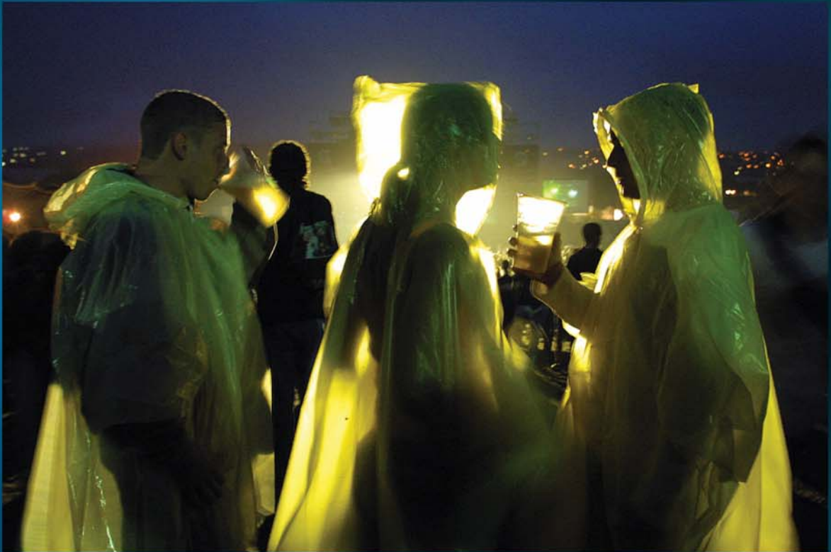
"Par de tres" / De la serie "RnR vivo"