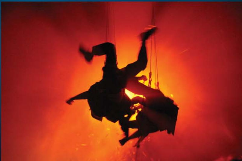
De la Guarda / Editorial Lo Castillo (Chile)